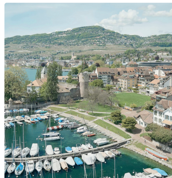
LA TOUR-DE-PEILZ | PORT