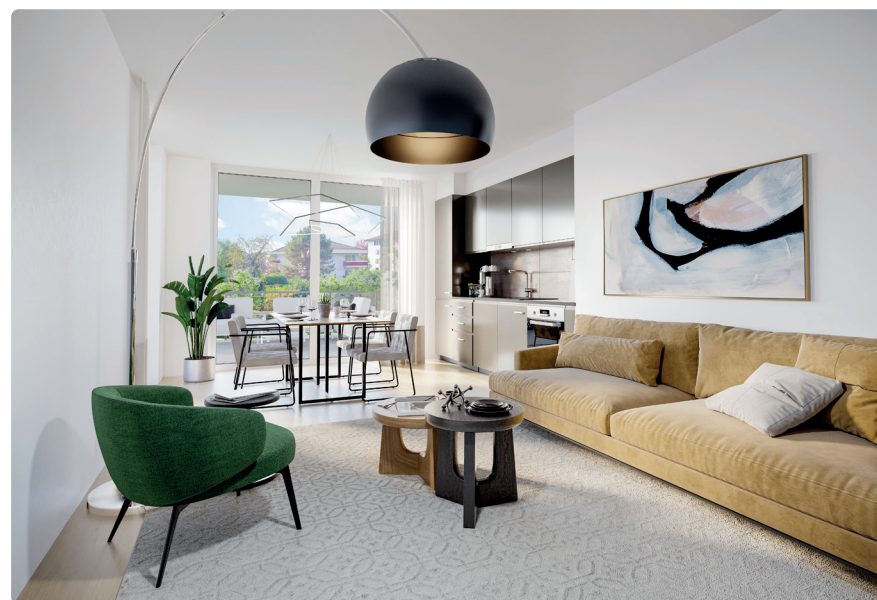
VUE INTÉRIEURE | SÉJOUR LOT A002