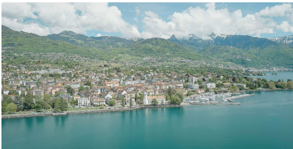
LA TOUR-DE-PEILZ | BORD DE LAC

DE LA GARDERIE AU GYMNASE, VOS ENFANTS PEUVENT FAIRE LEURS ÉTUDES SANS QUITTER LA COMMUNE