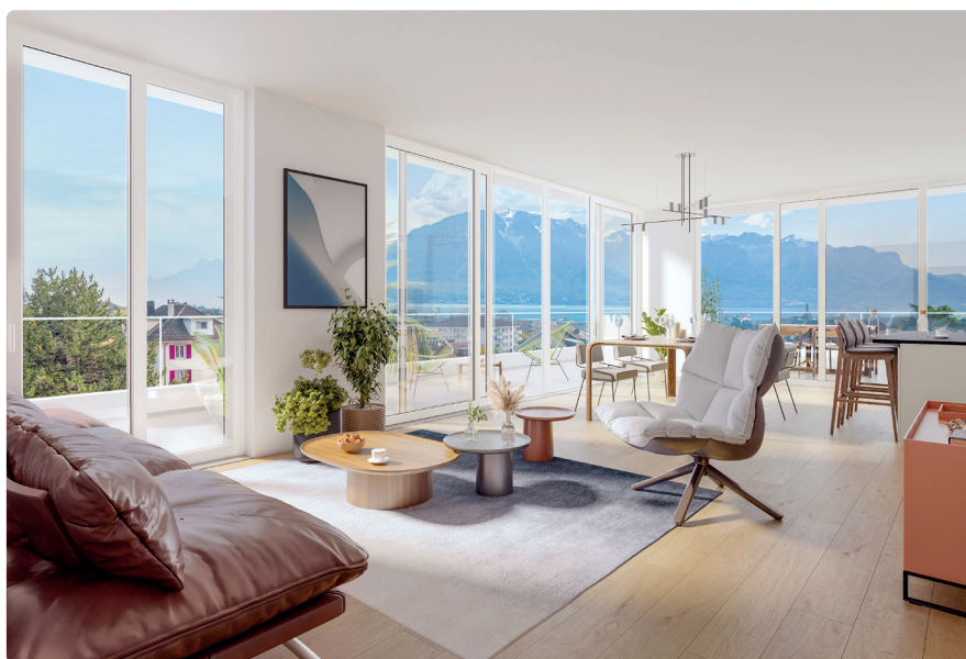
VUE INTÉRIEURE | SÉJOUR LOT A401